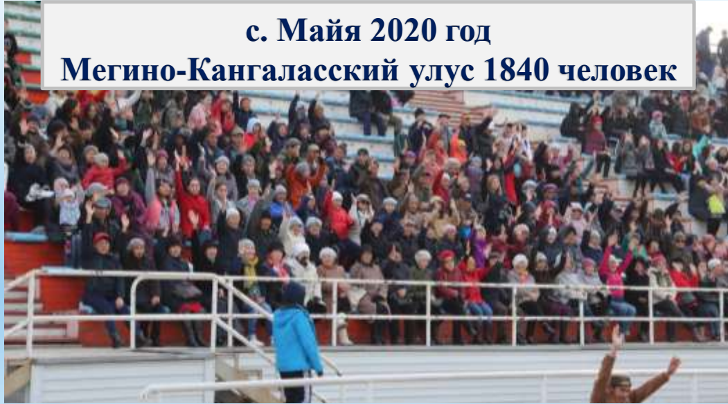
с. Майя 2020 год Мегино-Кангаласский улус 1840 человек