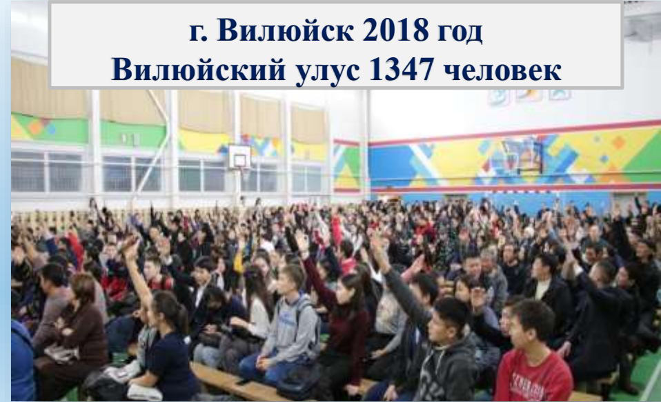
г. Вилюйск 2018 год Вилюйский улус 1347 человек