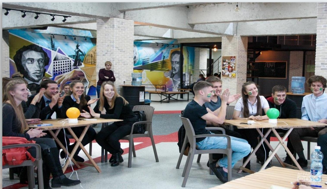
Создание центра «Молодежное пространство «Лофт» на базе МАУК «Ставропольский Дворец культуры и спорта» города Ставрополь