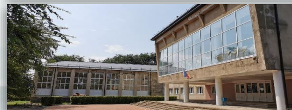
с. Спицевка, замена окон в ДК