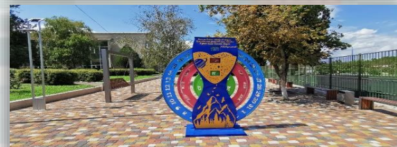
с. Тугулук, благоустройство территории прилегающей к ДК