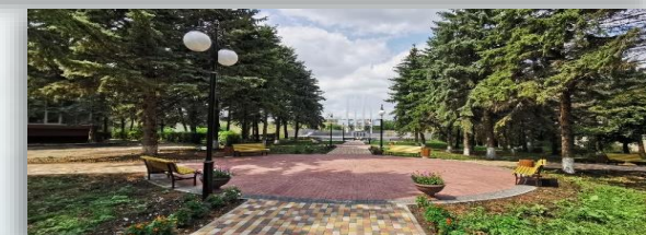
х. Мищенский, благоустройство парка