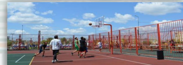
г. Невинномысск обустройство спортивной площадки