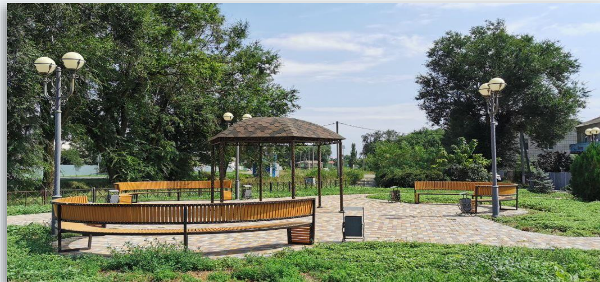
с. Грачёвка, благоустройство сквера Иверский