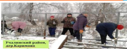
Учалинский район, дер.Каримово

Практики ИБ - Программа поддержки местных инициатив (ППМИ) Всемирного банка; «Народная инициатива», «Народный бюджет» в регионах РФ; каноническое Партисипаторное бюджетирование (Европейский Университет в Санкт-Петербурге при поддержке Фонда Кудрина).