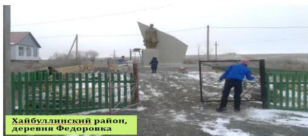
Хайбуллинский район, деревня Федоровка

Вклад населения безвозмездным трудом на примере Республики Башкортостан